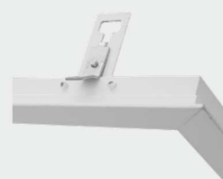
Detailansicht Halter Detail view holder