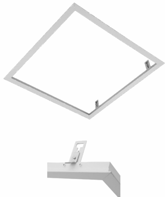
Detailansicht Halter Detail view holder