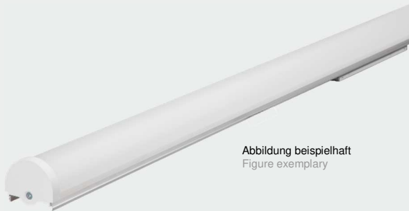
Abbildung beispielhaft Figure exemplary

LED Universalgeräteträger mit zertifizierten und hocheffizienten LED-Modulen und Treibern. LED universal equipment carrier with certified and highly efficient LED modules and drivers.