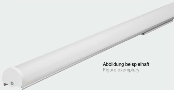
Abbildung beispielhaft Figure exemplary

LED Universalgeräteträger mit zertifizierten und hocheffizienten LED-Modulen und Treibern. LED universal equipment carrier with certified and highly efficient LED modules and drivers.